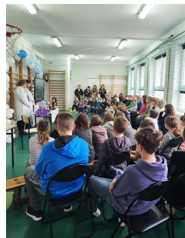
Karolina Roszkiewicz Szkola Podstawowa w Mariance

15 marca zostały ogłoszone wyniki głosowania. W wyborach wzięło udział 115 osób, dwie oddane karty były nieważne. Wygrały projekty: Szkolny ogródek (34 głosy), Kącik ciszy (33 głosy) i Majsterkownia (22 głosy), które otrzymają do 1000 zł każdy. Cały projekt finansowany jest przez Islandię, Liechtenstein i Norwegię z Funduszy EOG i Funduszy Norweskich w ramach Programu Aktywni Obywatele – Fundusz Regionalny. Uzyskane pieniądze pozwolą na realizację poszczególnych zadań. Cieszymy się, że nasi uczniowie chętnie angażują się w sprawy szkoły, są współodpowiedzialni za miejsce, w którym na co dzień się uczą i spędzają czas pozalekcyjny.